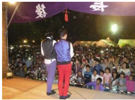
ピスタチオの登場に会場は大興奮！大人も子ども大喜び。

たすためにこの世の中に生まれ、置かれた環境や境遇の中で精一杯努力し自分与えられた役割を果たす事は「一隅を照らす」と伝教大師最澄の「山家学生式」の教えです。(野渡 訓)