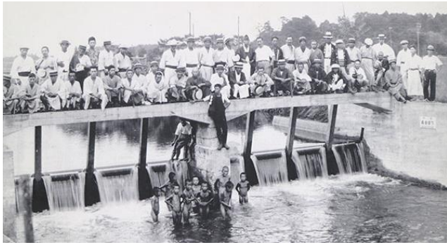
以前の下高倉堰(境川高飯堰)も現在はゴム製の堰(ラバーダム)となっている。