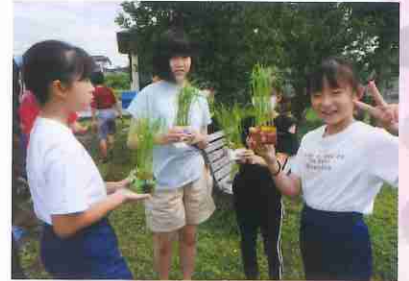
準備完了! さあ植えてみよう!