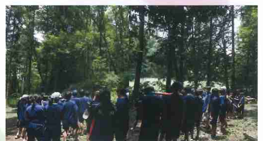
公園の奥はとても自然豊かでした

この日はとても蒸し暑く生徒たちは汗だくになりながらも頑張ってくれました！ 来年きれいな花を咲かせますのでぜひ見に来てくださいね！