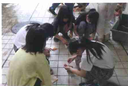
上手にできたかな?