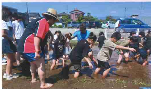
先生の熱い声援の中頑張りました!