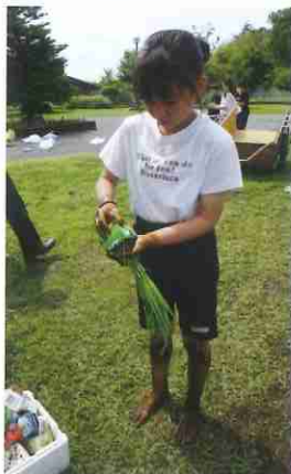
慣れてきて苗の外し方も上手に!