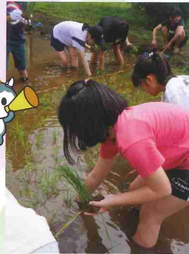
5束ほど取って植えます