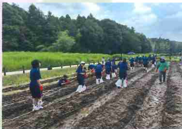
畑はとってもめぐるんでいます