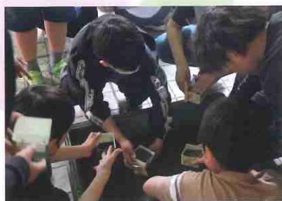
1パックに25粒ほどまきます