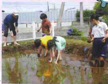
田んぼは滑りやすい