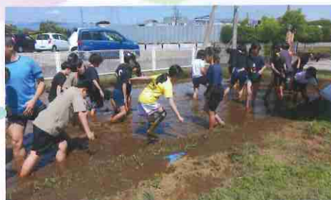
みんな泥だらけになりながらも頑張ってくれました!

代かきってなに? 水田に水を入れて泥状にし かき混ぜて水田の水漏れや 雑草を防ぐこと。