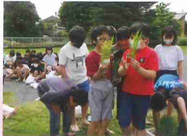
苗は大きくなったかな?