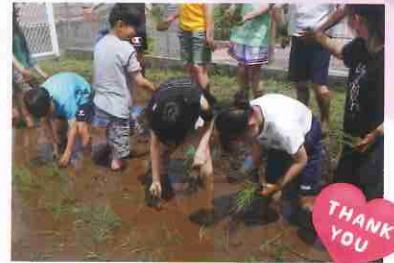
何度も植えてくれる生徒もいました