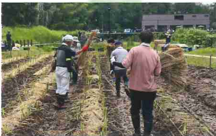
最後に虫が入らないようにワラを敷きます