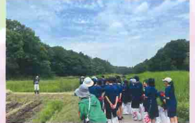
花菖蒲の苗の植え方の説明を受けました