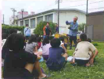
苗は優しく持って植えます