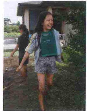
泥だらけになりながらも頑張ってくれました