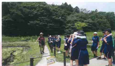
公園の愛護団体による自然教室