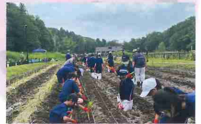
一列植えるのはとても大変