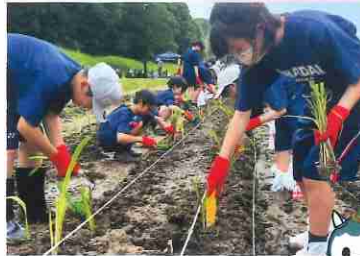
丁寧に植えています