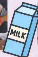
牛乳パックを使って種(米)をまきました!