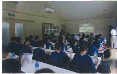
園内の施設で生物多様性について学習しました