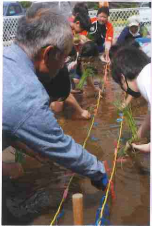
間隔をあけて植えます