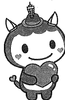
救命講習Ⅰ 成人に対する 応急手当