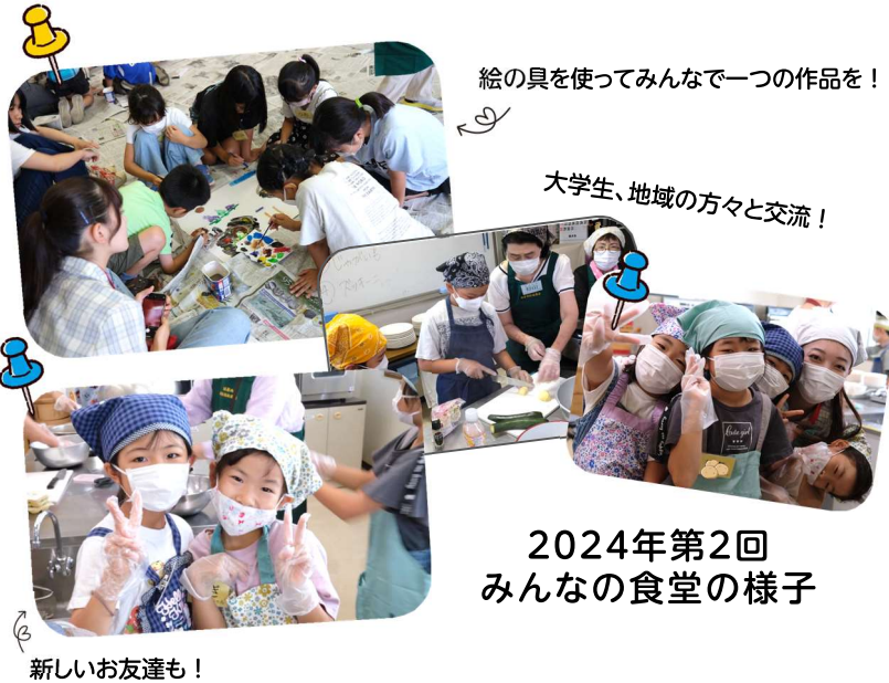
2024年第2回 みんなの食堂の様子