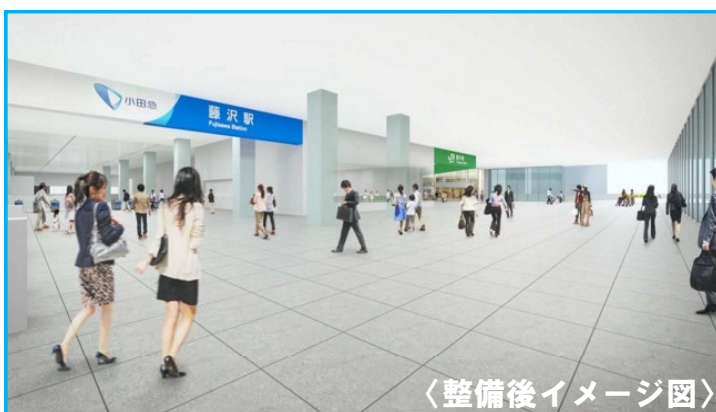
〈整備後イメージ図〉