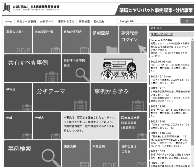
図表IV-1 ホームページのトップ画面

本事業では、事業計画に基づいて、報告書や年報、共有すべき事例、事例から学ぶ等の成果物や、匿名化した報告事例を公表している。本事業の事業内容の掲載情報については、パンフレット「事業のご案内」に分かりやすくまとめられているので参考にさせていただきたい ( http://www.yakkyoku-hiyari.jcqh.or.jp/pdf/project_guidance.pdf )。