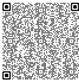
アンケート調査フォーム QR コード

URL : https://forms.office.com/r/epQ1TRdasb