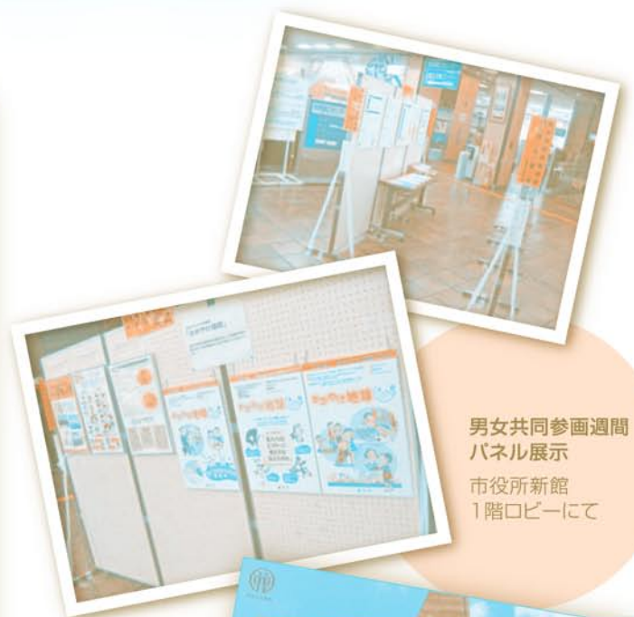
男女共同参画週間 パネル展示 市役所新館 1階ロビーにて