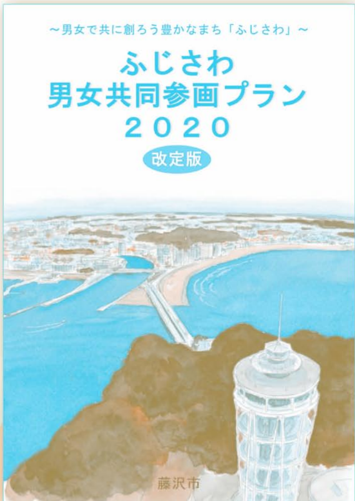
「ふじさわ男女共同参画プラン 2020 改定版」冊子