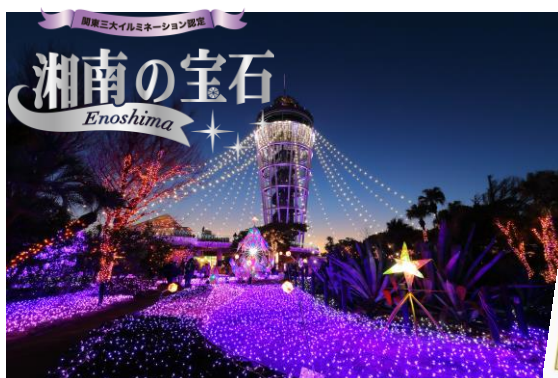
▲「イルミネーション イベント部門 優秀ストーリー賞 第2位」 を受賞した「湘南の宝石」