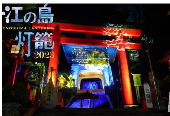
▲「関東三大夜灯」に認定された「江の島灯籠」

さらにこれまでの「イルミネーションアワード」を世界へ向けて発信できるよう、リブランディングした「International Illumination Award」において、「湘南の宝石～江の島を彩る光と色の祭典」がイルミネーション イベント部門 優秀ストーリー賞 第2位を受賞しました。