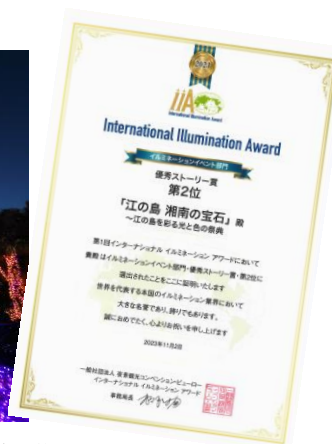
イルミネーション イベント部門 賞状