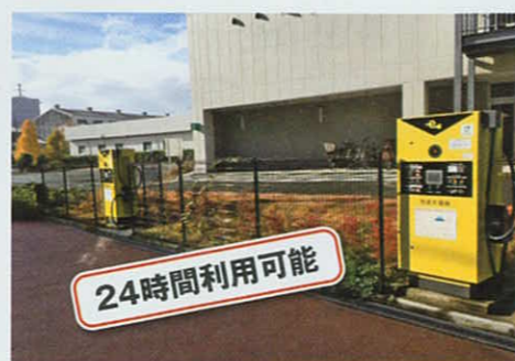
電気自動車用急速充電器