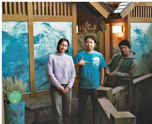
左側から、「株式会社グリーンディスプレイ」「ユニリーバ・ジャパン・カスタマーマーケティング株式会社」「株式会社アートモリヤ」

美化緑化の実施にあたり、ユニリーバ・ジャパン・カスタマーマーケティング株式会社を始め、関係者が1月中旬に表敬訪問される予定です。詳細につきましては、別途お知らせいたします。