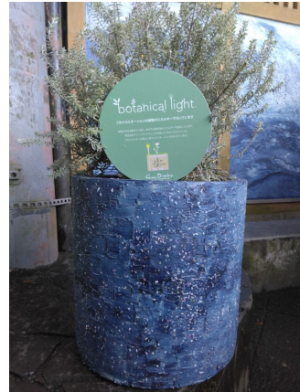
ボタニカルライト