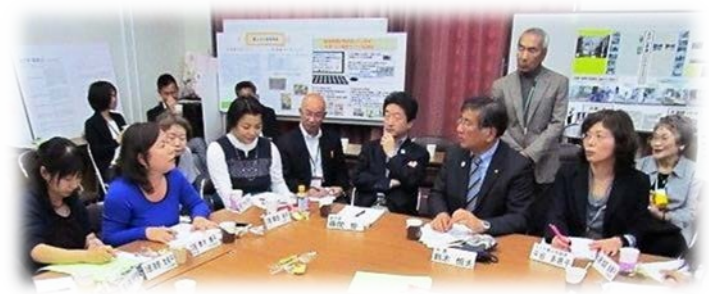
地区集会で活発な意見交換

きな成果でした。今後も、手法を工夫しながら実施してまいりますので、一層のご参加をお願いいたします。