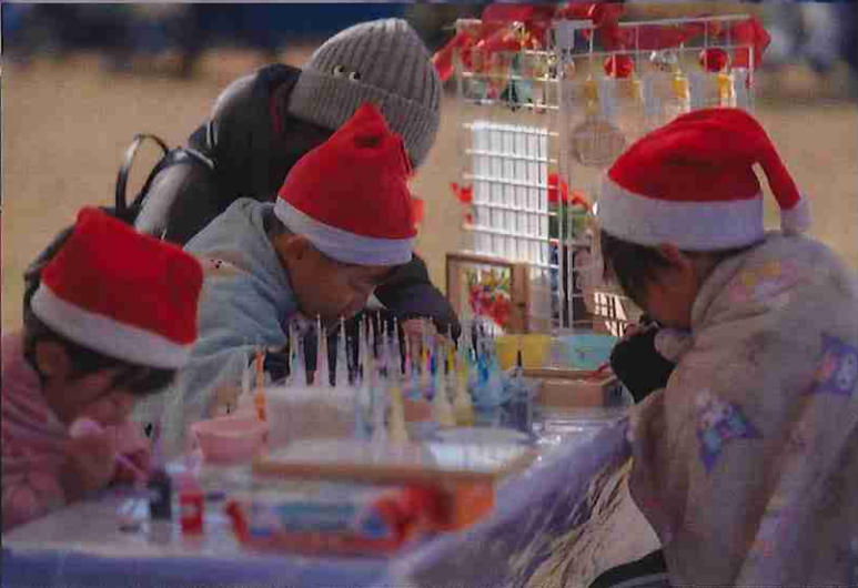
※12月クリスマスマーケット時の写真となります