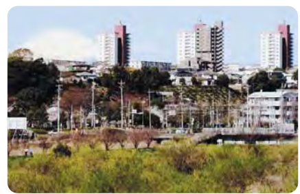
2 緑地や道路がゆとりをもって配置された湘南ライフタウン 高層棟と低層住宅街を計画的に配置し、T字路が多く、歩行者も安心できる住宅地です。

コラム 舟地藏交差点の脇にまつられている舟地藏、実は臺谷戸稲荷周辺に本来の舟地藏があります。本来の舟地藏は、舟に対して横を向いていますので、探してみてください。