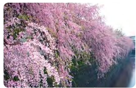
4 小糸川沿いのしだれ桜 春の永山橋周辺のしだれ桜は、色鮮やかに川面を染め、人々を魅了します。