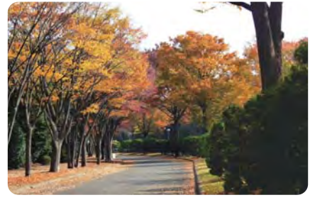
8 ピクニックもできる大庭台墓園 芝生がよく手入れされ、四季の花でいっぱいの園内では、ウォーキングなどが楽しめます。