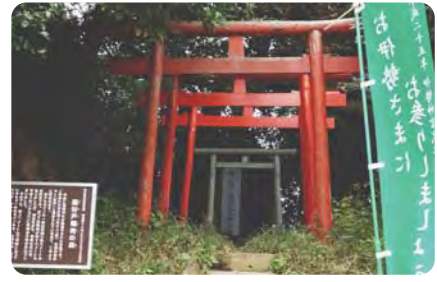
10 里山の風景の残る臺谷戸稲荷周辺 農地、梅林、昼でも薄暗い谷戸の坂道など、大庭の原風景を見ることができます。