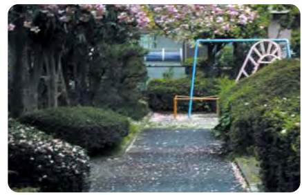
7 公園と住宅地を結び緑のプロムナード 手入れの行き届いた数多くの公園とそれらを繋ぐ緑道は、住民の方々の努力で支えられています。