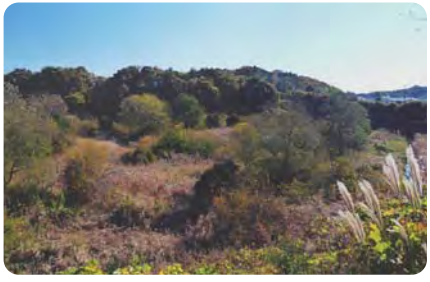
9 バードウォッチングのできる裏門公園 観察台から眺めると、たくさんの緑と豊かな水辺に集う様々な野鳥を垣間見ることができます。