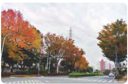
3 中央けやき通りと幹線の並木道 四季を彩るけやき並木の他にも、アメリカ楓など様々な街路樹が街に潤いを与えています。