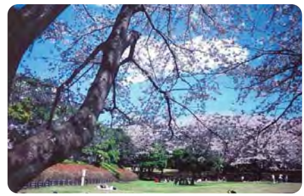
5 中世の遺構を残す大庭城趾公園の春秋 春は、落ち着いてお花見を楽しめる桜の名所、秋は紅葉を見ることができる公園です。