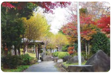
6 水の流れる珠玉の二番構公園 湘南大庭の公園で唯一の水の流れる公園。様々な水の流れを見ることができます。