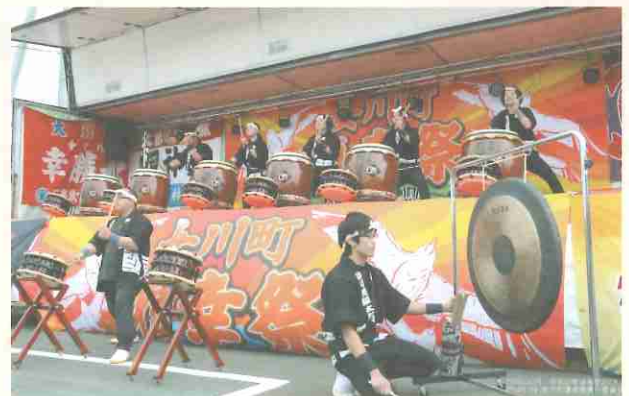
▲昨年開催された様子

◀「津波が来たら高台へ逃げる」という津波避難の基本を、何かの形で後世へ伝え続けたい…。女川町の民族伝承となるように育てていきたいとの思いから、この「祭」がスタートしました。JR女川駅付近をスタートし、高台にある白山神社を目指します。