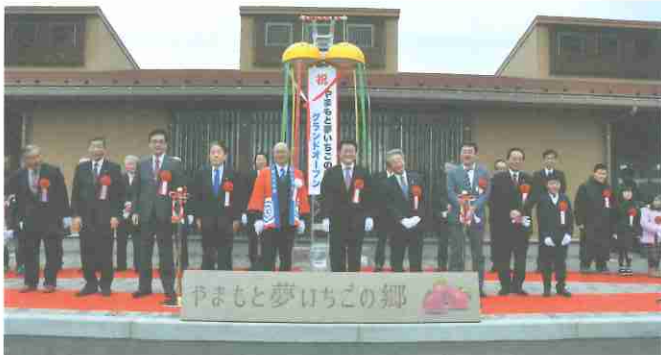
▲オープニングセレモニーの様子

オープニングセレモニーが行われた2月9日には多くの方が訪れ、一度に入店できる人数が制限されるほどの大盛況となりました。