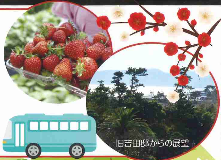
旧吉田邸からの展望