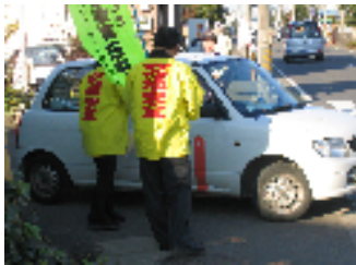
交通安全キャンペーンの様子