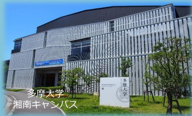
多摩大学 湘南キャンパス