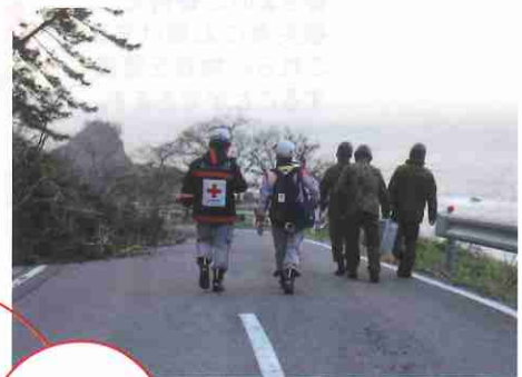
▲寸断された道路を自衛隊員と進む同救護班(石川県珠洲市)