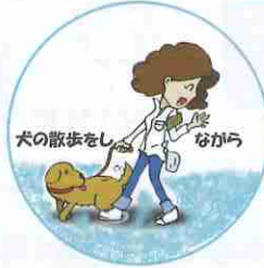
犬の散歩をしながら