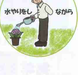
水やりをしながら

登下校児童を見守る「ながら見守り」活動が注目されています。皆さんも御協力をお願いします!