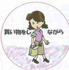
買い物をしながら