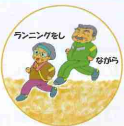
ランニングをしながら