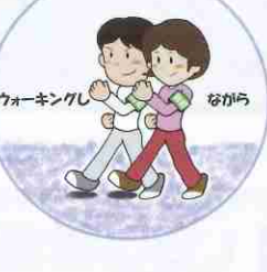
ウォーキングをしながら