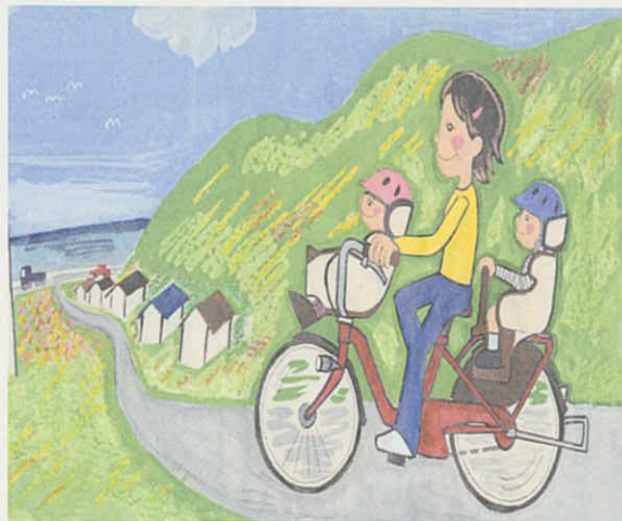
図 幼児二人同乗用自転車