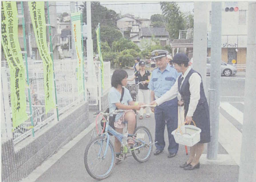
図 藤沢各地区での啓発活動