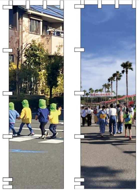
※フラッグイメージ