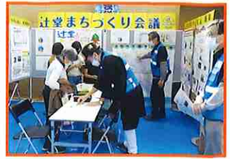
「辻堂の気になる木」参加者集計結果

「辻堂の気になる木」、「ぼくらのあそびばしょ」と題して、辻堂の気になるところや子どもたちの遊び場に関するアンケート調査を実施。たくさんの方がご協力くださり、ありがとうございました。いただいたご意見は今後の参考にさせていただきます。