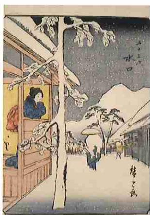
歌川広重「五十三次 水口」 (人物東海道)