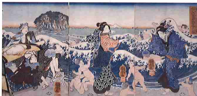
歌川芳雪「相州江之島詣春の賑」

歌川広重(一七九七-一八五八)は、東海道の揃物(シリーズ)を二十種余り描きました。当時の旅ブームもあり、「東海道五拾三次之内」(保永堂版)が大ヒットしたことで、その後多くの版元たちから広重に東海道を主題にした揃物の制作依頼があったためです。人々を飽きさせない広重の創意あふれる工夫もあって、多様な東海道の揃物が次々と刊行されました。今回の展示では、各宿場の風景とともに細やかな人物描写が特徴の「五十三次」(通称「人物東海道」)を中心に、広重が描く当時の旅の様子、風物や季節を紹介します。「人物東海道」から広重が描く当時の情景をお楽しみください。