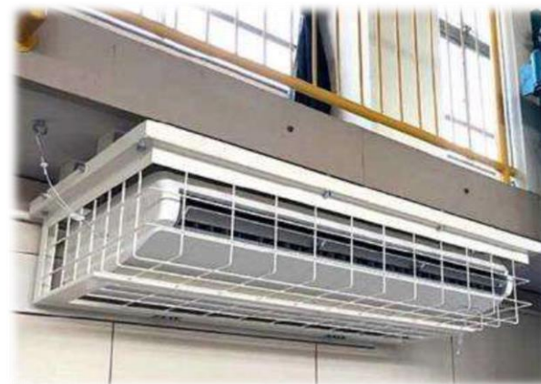
体育館空調イメージ